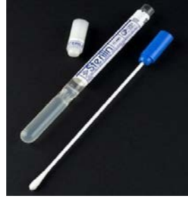
B. Genel Transport