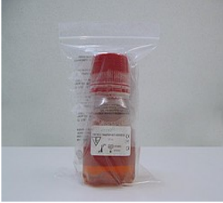
İ. Spesifik Taşıma kapı