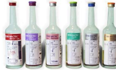
F. Hemokültür Şişeleri