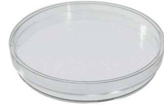
L. Petri Kapı