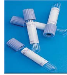
I. EDTA'lı tüp