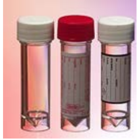
D. Steril Taşıma Kapları