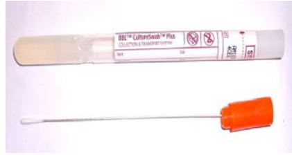
J. Özel ince swab