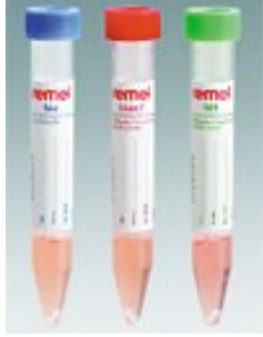
G. Viral Transport