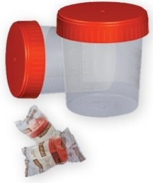
A. İdrar Kapı