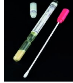
C. Özel Transport