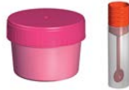
E. Gaita Kapları